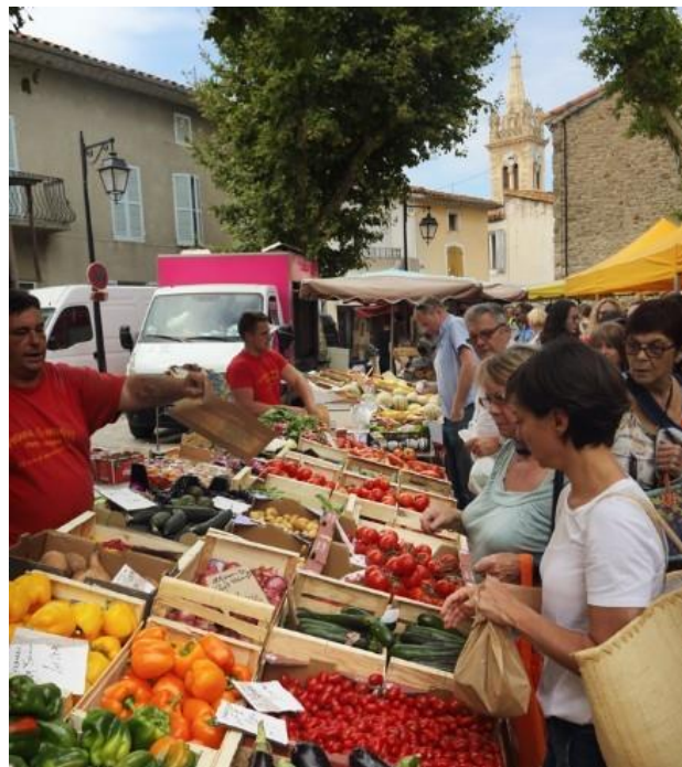
Marchés de plein vent de Saint-Chinian